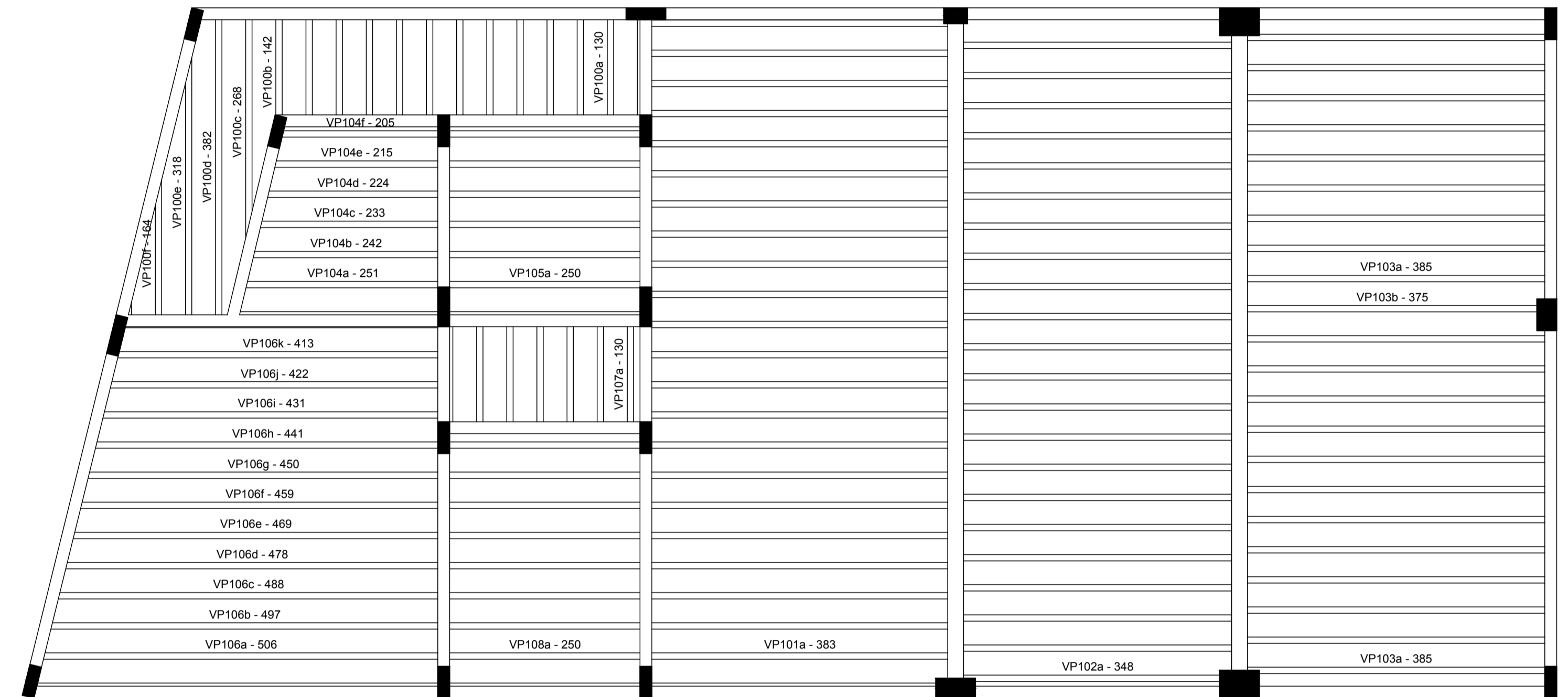
Planta de vigotas pré-moldadas escala 1:50